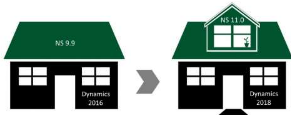
Figur: Opgradering til Navision Stat version 11.0

Økonomistyrelsen udvikler og vedligeholder de statslige tilpasninger og opgraderer platformen efter behov på baggrund af frigelserne fra Microsoft.