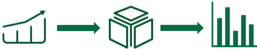
Figur: Data fra Navision Stat overføres til SBI (LDV), som danner rapport.

Økonomistyrelsen har valgt Statens Business Intelligence (Lokalt Datavarehus, LDV) til lokal analyse og ledelsesmæssig rapportering.