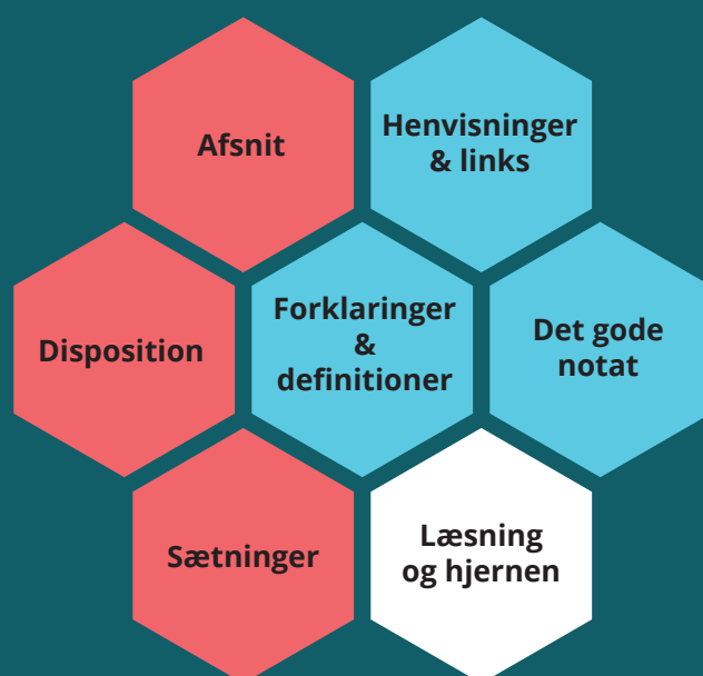
Moduler i skriftlig kommunikation

Hvert kursus har fokus på et af de elementer, der tilsammen afgør klare og entydige tekster: dispositionen, afsnit, sætninger, forklaringer & definitioner og henvisninger & links. Endelig har vi derudover produceret et overordnet modul, der netop formidler tips om et af de mest brugte genrer i det offentlige: notatet.