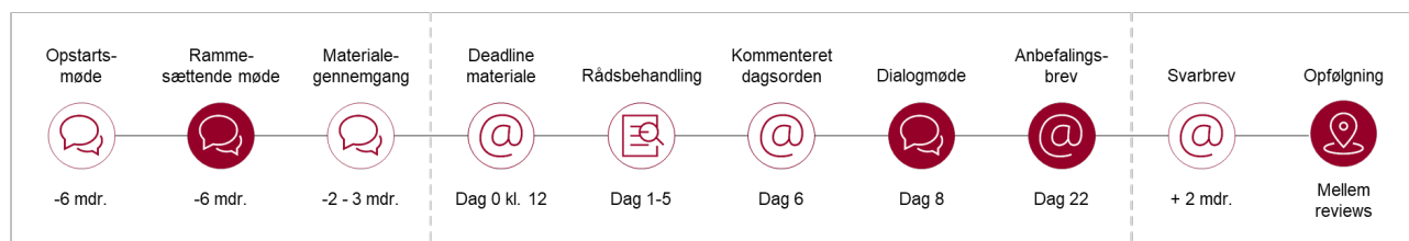
Figur 1.1: Proces for review af it-systemporteføljestyring i statslige myndigheder 1

Sideløbende med ovenstående pågår også en årlig statusrapportering til regeringen, som indledes efter myndighedens første review. Denne er beskrevet i kapitel 4 omkring opfølgning og rapportering til It-rådet.