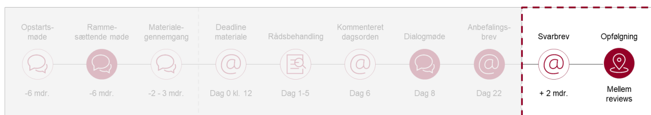
Figur 4.1: Proces for opfølgning efter review ved Statens It-råd (ekskl. statusrapportering) 5

Efter review hos It-rådet er der en opfølgnings- og rapporteringsproces, som illustreret i Figur 4.1.